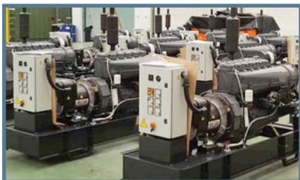
GRUPE ÉLECTROGÈNE SUR CHÂSSIS