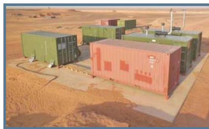
CENTRALE ÉLECTROGÈNE AUTONOME