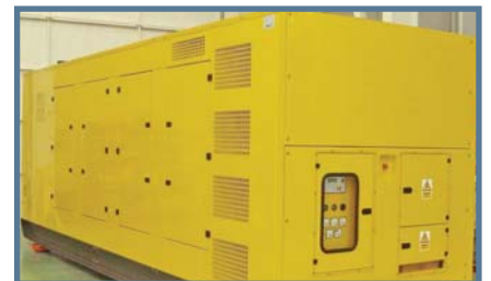
GRUPE ÉLECTROGÈNE CAPOTÉ INSONORISÉ