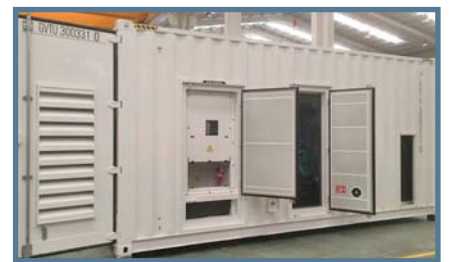
GRUPE ÉLECTROGÈNE CONTENEURISÉ