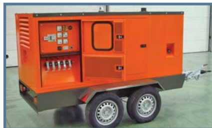
GRUPE ÉLECTROGÈNE MOBILE