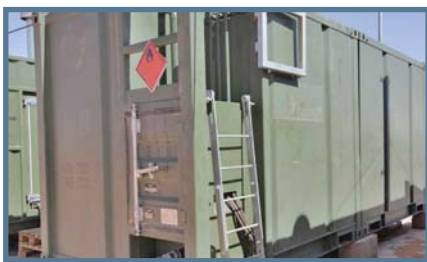
CONTENEUR RÉSERVOIR CARBURANT

“ Parce que votre projet ne ressemble à aucun autre, les équipes de Kapi Konzept l’étudient dans le moindre détail afin de vous proposer des solutions opportunes et pertinentes, adaptées à vos besoins en production d’énergie et aux conditions envisagées d’utilisation des matériels. ”